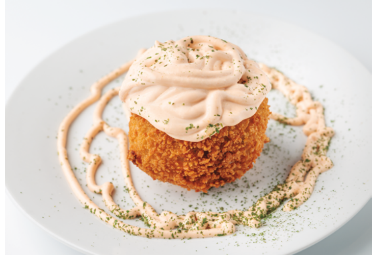
Bomba casolana farcida de carn amb la nostra salsa brava