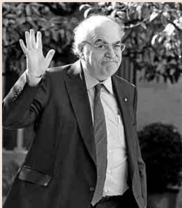
Andreu Mas-Colell, conseiller de Economia.

El FLA ha permitido a la Generalitat ahorrarse la solicitud de créditos puente o demorar en algunos pagos, pero también saldar compromisos inmediatos con entidades financieras y estirar en el tiempo su devolución. Este mecanismo, por ejemplo, permite devolver el dinero en un periodo de doce años, con dos de carencia. Además, el tipo de interés se situó en un máximo del 6%, por debajo del 8%